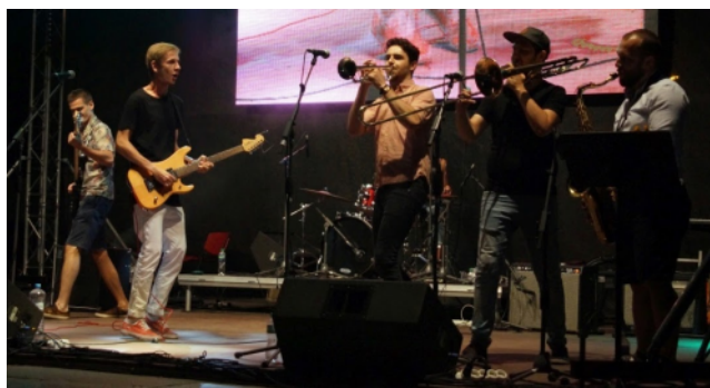
La loka grupo Sematam