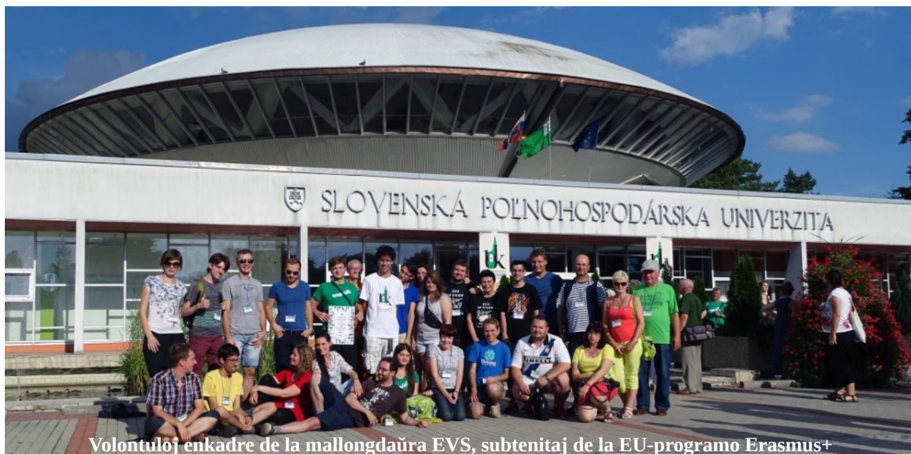
Volontuloj enkadre de la mallongdaŭra EVS, subtenitaj de la EU-programo Erasmus+