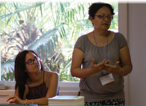
Prelego dum ILEI-kongreso

La Komitato kunvenis en Lisbono dum dek horoj en la pleno kaj en la kutimaj kvar Komitataj Forumoj pri la