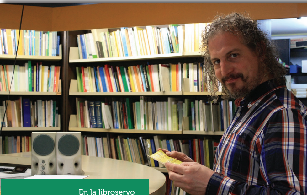
En la libroservo

La Libroservo , prizorgita de I. Oneĵ, vendis por iom malpli ol €80 000 en 2018 – pli bona rezulto ol en 2017, sed je €12 000 malpli ol buĝetite, malgraŭ relative granda kongreso. UEA eldonis la aktojn de la 71-a sesio de la Internacia Kongresa Universitato (red. A. Wandel, 189 p.) kaj detalan, faktoriĉan historion de Esperanto en Indonezio, Movadaj Insuletoj , de H. Goes. Kadre de la Serio Oriento-Okcidento aperis Sieĝata fortikaĵo de Qian Zhongshu (tradukis Wei Yida, eldonis Ĉina Fremdlingva Eldonejo), La strangaĵoj de Liaozhai de Pu Songling (tradukis Guozhu, eldonis Zaozhuang-a Universitato kunlabore kun Impeto) kaj La ponto super Drino de Ivo Andrić (tradukis Ljiljana Sekelj Milenković, eldonis Dokumenta Esperanto-Centro).